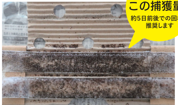
設置5日前後のワクモホーム