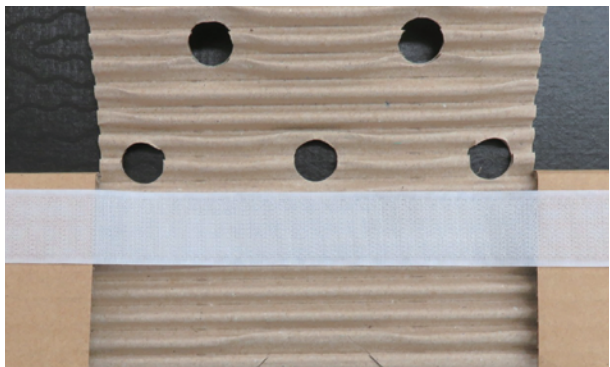
設置前のワクモホーム